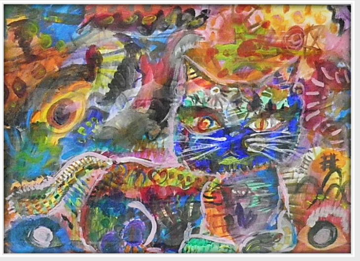
第26回長野県障がい者文化芸術祭 絵画部門 最優秀受賞(長野県知事賞)